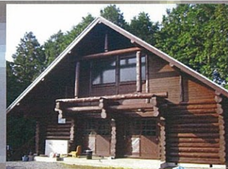
バンガローの施工