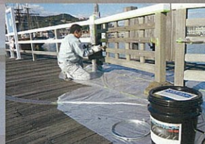
ハウステンボス 栈橋手すり

キャンプ場のバンガローの床下です。白蟻の多い山中でも、自然に優しいヘルスコ・キュアーがその威力を発揮します。