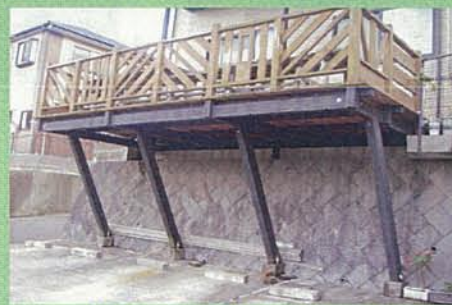
バルコニー支柱部分に塗布

～長崎県 佐世保市～ 『ヘルスコ・キュアー』が塗布され7年が経過した住宅のバルコニーの支柱です。長い月日を経ても、塗膜面もしっかりしており、木材部の腐食もありません。