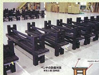
アーテック工房、工場内にて『ヘルスコ・キュアー』が塗布されたベンチとプランター

上部のマリン専用ペイントは、同日に塗ったのですが、2年の経過で塗膜が剥離してきています。それに比べ『ヘルスコ・キュアー』の塗膜面は剥離も無く、木部を完全に保護しています。